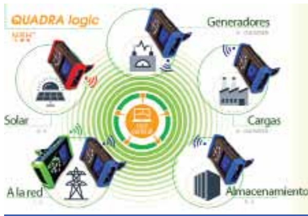
Quadra Logic, con tecnología MRH, interconexión inalámbrica

el caso de corrientes, uno de los cuales se puede utilizar para medir tensión y corriente continua. Al igual que su hermano menor, el NanoVIP Two , tiene las mismas cualidades en precisión y tipo de mediciones, y autoverificación de la conexión realizada con respecto a la configuración de programa para chequear que sean concordantes. También puede guardar valores mínimos, máximos, medios e instantáneos, y monitorear el arranque de motores o máquinas eléctricas para determinar su corriente, o señales no simétricas para el control de PWM de inversores. Permite seleccionar patrones de tiempo para obtener una tendencia de comportamiento dentro de ese rango y poder evaluar con mayor detalle.